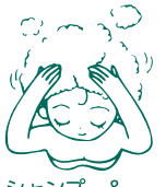
シャンプー& コンディショナー