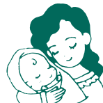
病後・産後の脱毛