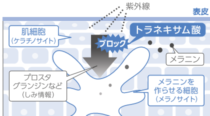
トラネキサム酸の働きイメージ図

美白有効成分「トラネキサム酸」により、メラニンをつくらせる「しみ情報」をブロック。しみ*2の根源にアプローチし、メラニンの生成連鎖を抑止します。