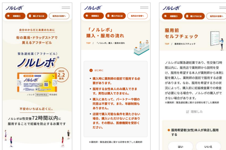
ノルレボ ブランドサイト画面イメージ

これらの取り組みを通じて、普段から避妊について正しく知り、考えるきっかけを提供するとともに、緊急避妊薬が必要になった時から服用後の体調管理まで、総合的にサポートする環境を整備します。