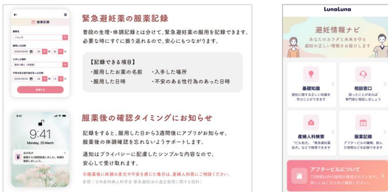
ルナルナアプリ 画面イメージ