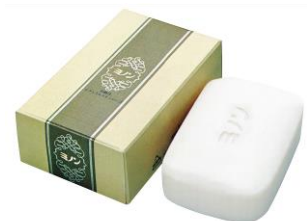
「ミノン」（現・「ミノンスキンソープ」） 1973年発売

赤ちゃんからご高齢の方までお使いいただけるブランドであり続けるために、一貫して今もこの考え方を守っています。