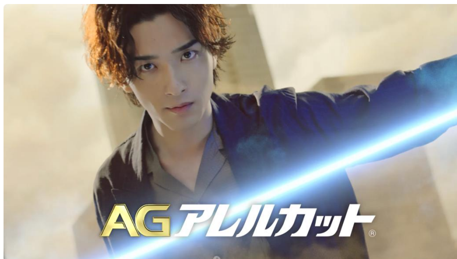
新 TV-CM『花粉をカット』篇より

第一三共ヘルスケア株式会社（本社：東京都中央区）は、CM キャラクターとして俳優・横浜流星さんを起用した、アレルギー専用点鼻薬「エージーアレルカット」シリーズの新 TV-CM「花粉をカット」篇（15秒）を、本年1月26日（金）から全国で放映開始します。