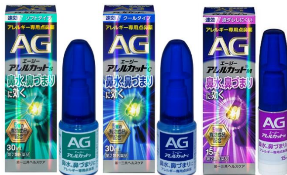
エージーアレルカットS エージーアレルカットC エージーアレルカットM

アレルギー専用点鼻薬「エージーアレルカットS/C/M」は、殺菌成分「セチルピリジニウム塩化物水和物（CPC）」を追加配合し、エージーアレルカット点鼻薬シリーズ史上最多となる5つの有効成分（*1）を配合した処方を実現しました。