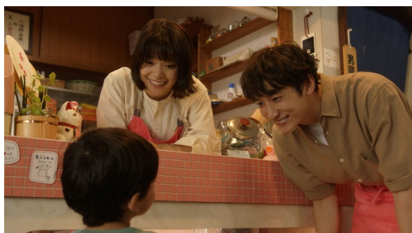
新TV-CM「小さな常連さん」篇より