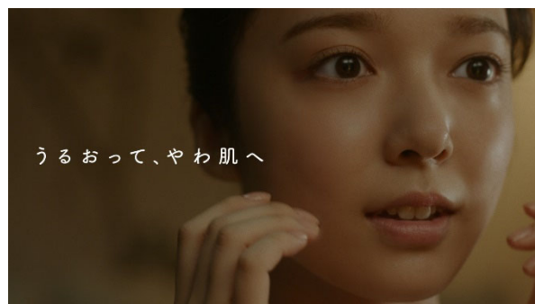
新TV-CM「ゆらがんぞ」篇より

第一三共ヘルスケア株式会社は、敏感肌向けスキンケアシリーズ「ミノン」において、新たなイメージキャラクターを迎えたボディケアシリーズ・フェイスクケアシリーズの新TV-CMを、2020年9月28日（月）に全国にて放映開始いたします。ボディケアシリーズとしては、俳優・岸井ゆきのさんと小関裕太さんを起用したミノン全身シャンプー「二人のこれから」篇・ミノン全身保湿剤「小さな常連さん」篇、フェイスクケアシリーズとしては、上白石萌音さんを起用したミノン アミノモイスト「ゆらがんぞ」篇を展開いたします。