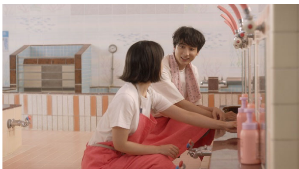
新TV-CM 「二人のこれから」篇より

「小さな常連さん」篇では、小さな男の子に対して、アキとトシがあたたかい笑顔で話しかけている様子や、CM最後になっこりと視線を合わせる姿にほのぼのしてしまいます。