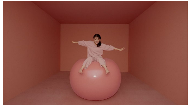
新TV-CM 「ゆらがんぞ」 篇より