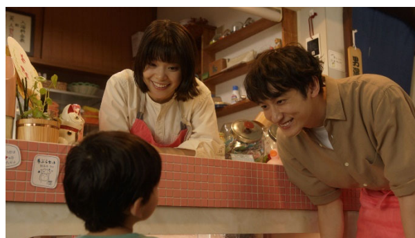
新TV-CM 「小さな常連さん」篇より