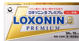
「ロキソニンSプレミアム」