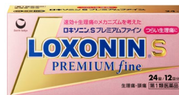
「ロキソニンSプレミアムファイン」