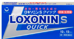
「ロキソニンSクイック」