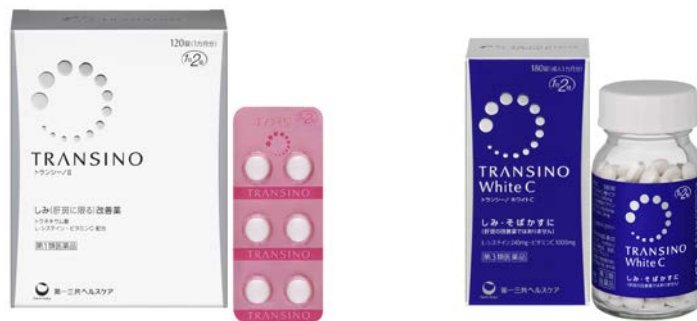
左から、 「トランシーノⅡ」 「トランシーノ ホワイトC」