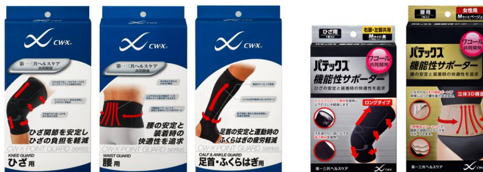
「CW-X POINT GUARD」 販売元:ワコール

ワコールからは「CW-X」ブランドより「CW-X POINT GUARD(ポイントガード)」をコンディショニングストアおよび全国の百貨店スポーツ売場、スポーツチェーン店の一部などで、本年8月下旬に発売。第一三共ヘルスケアからは「パテックス」ブランドより「パテックス 機能性サポーター」を全国の薬局・ドラッグストアで、本年8月22日(水)に発売します。