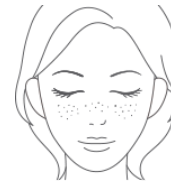
在儿童期出现的小的色素斑。非肝斑。